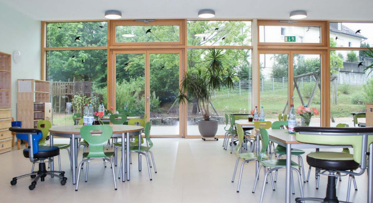
Kindertageseinrichtung Kinderneest Nord-West, Gemeinde Pfedelbach