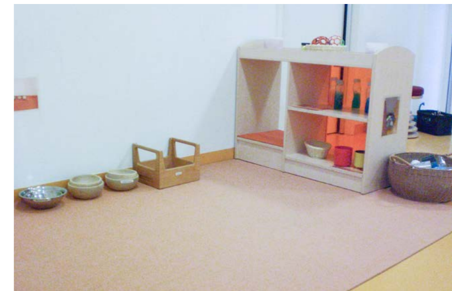
Tageseinrichtung für Kinder Tunzhofer Straße (Einstein- Kita), Stadt Stuttgart

Durch einen direkten Zugang vom Gruppenraum ins Außengelände kann dieses wesentlich intensiver in den Alltag miteinbezogen werden. Ein zusätzlicher Raum zur Differenzierung schafft die Möglichkeit, die Gruppe in Kleingruppen zu trennen und so auch altershomogene Angebote anzubieten.