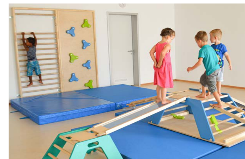
Kita Haus der kleinen Hasen, Gemeinde Reilingen