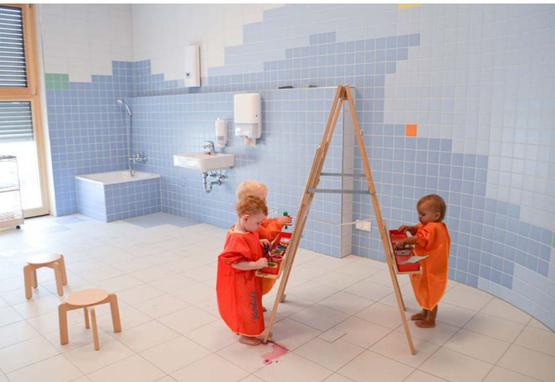
Kita Haus der kleinen Hasen, Gemeinde Reilingen

Das Atelier sollte über einen Wasseranschluss und ein Waschbecken in Kinderhöhe verfügen, der Raum gefliest oder mit einem unempfindlichen anderen Boden ausgestattet sein. Für die Kinder sollen Material wie Papier, Knete, Farben und Naturmaterialien gut erreichbar sein, um diese selbstständig benutzen und auch wieder aufräumen zu können. Für die Malkittel sind Haken in der Wand oder eine Garderobe vorzusehen. Zum großflächigen Malen laden Staffeleien und großes Papier ein.