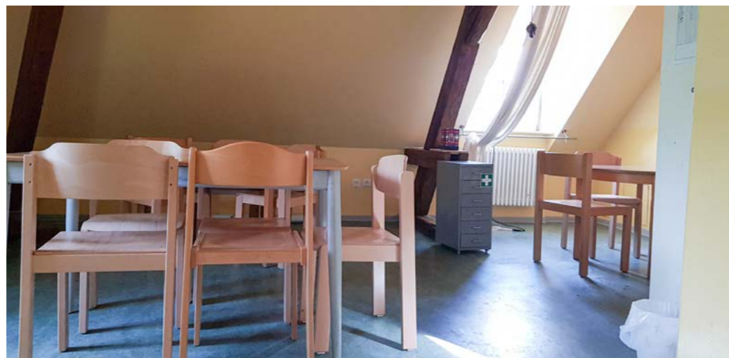
Kinderhaus Dorothea Wespín, Stadt Mannheim

Im Außenbereich laden etwa Tischtennisplatten und ein Basketballfeld zur Bewegung ein. Befindet sich die Einrichtung auf dem Schulgelände, können vorhandene Angebote (Schulhof, Sporthalle) mitgenutzt werden.