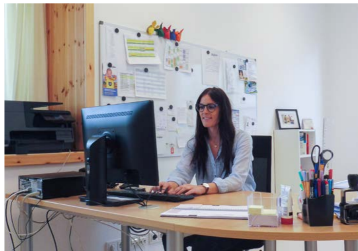
Kita Haus der kleinen Hasen, Gemeinde Reilingen

Das Büro sollte möglichst zentral im Eingangsbereich liegen, damit die Leitung präsent ist und als Ansprechperson direkt zur Verfügung steht. Sinnvoll ist es, auch Platz für einen Besprechungsbereich für Eltern- und Mitarbeitergespräche einzuplanen. Eine ästhetische Gestaltung des Raumes trägt zur angenehmen Gesprächsatmosphäre bei. Verschiedene Büro- und Ordnungssysteme unterstützen ein gepflegtes Erscheinungsbild und erleichtern das Arbeiten. Im Büro sollten Aufbewahrungsmöglichkeiten für Akten vorhanden sein, die auch dem Datenschutz Rechnung tragen.