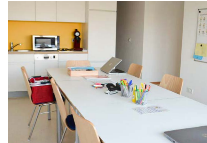
Kita Haus der kleinen Hasen, Gemeinde Reilingen

Für die Fachkräfte ist ein möglichst ruhig gelegener Pausenraum mit Platz für Schränke oder Spinde, in denen die Mitarbeiter ihre Wertsachen verschließen können, sinnvoll. Bei mehr als zehn Beschäftigten ist dies gemäß „§ 3 Abs. 4.2 Arbeitsstättenverordnung (ArbStättV)“ Pflicht. Für eine Teeküche, in der die Mitarbeiter sich etwas zu Essen zubereiten können und ein Sofa ist das Personal sicher dankbar.