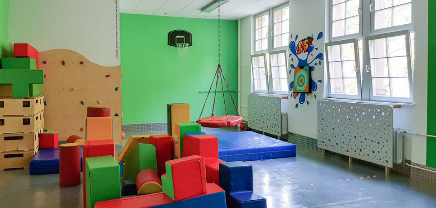
Kinderhaus Dorothea Wespín, Stadt Mannheim