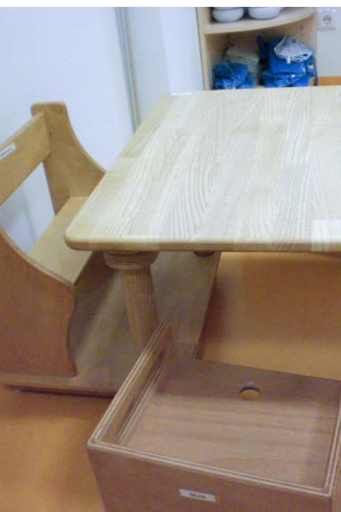
Tageseinrichtung für Kinder Tunzhofer Straße (Einstein-Kita), Stadt Stuttgart