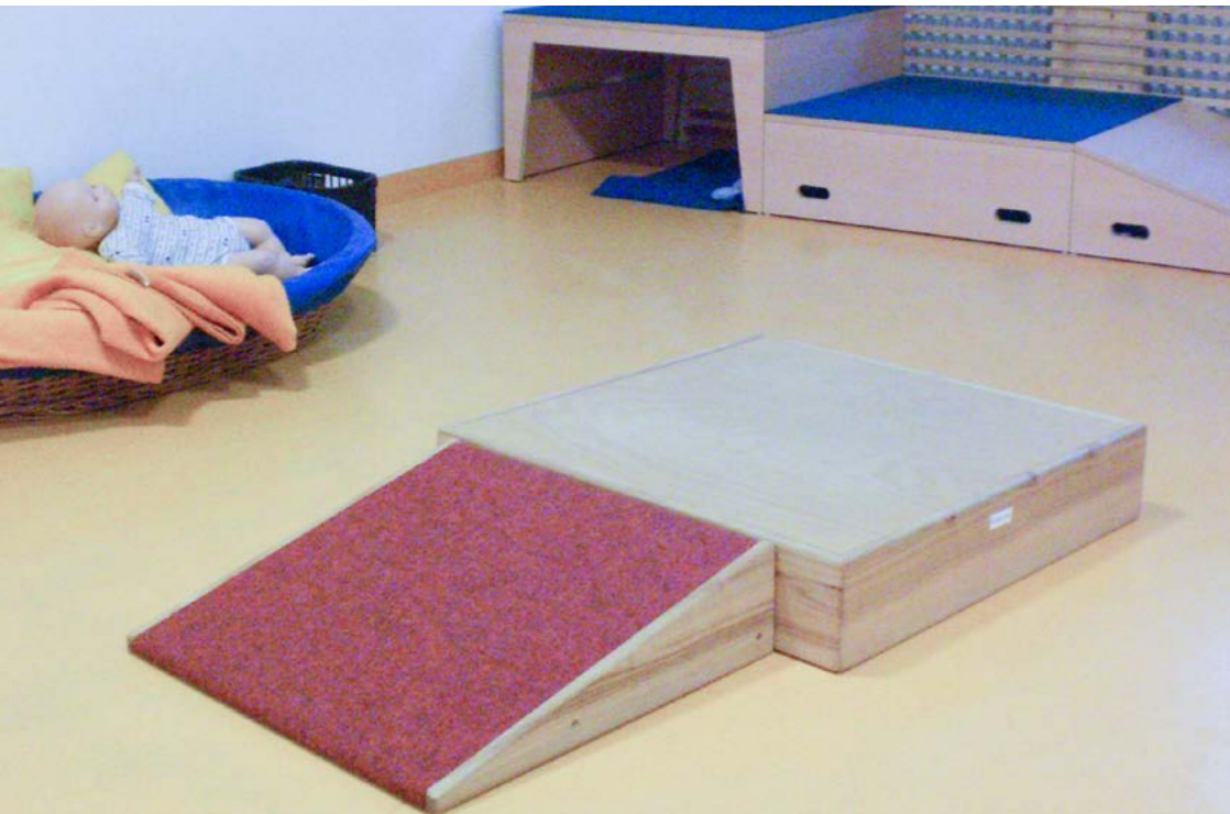
Tageseinrichtung für Kinder Tunzhofer Straße (Einstein- Kita), Stadt Stuttgart