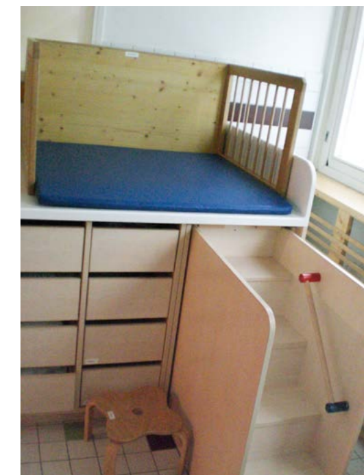
Tageseinrichtung für Kinder Tunzhofer Straße (Einstein-Kita), Stadt Stuttgart

Das An- und Ausziehen ist eine der Schlüsselsituationen im pädagogischen Alltag. In der Garderobe sollte deswegen ausreichend Platz eingeplant werden, damit sich die Kinder umziehen können, ohne dass sie sich stoßen. Kinder unter drei Jahren haben noch einen hohen Bedarf an Unterstützung beim An- und Ausziehen. Geeignet sind Podeste, bei denen ihnen die Fachkräfte assistieren können.