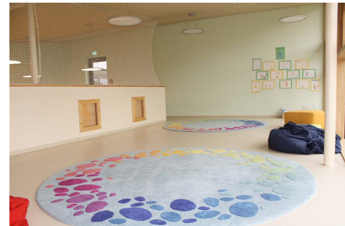
Kindertageseinrichtung Kindernest Nord-West, Gemeinde Pfedelbach

Darstellungen von Menschen, die die äußeren Merkmale der betreuten Kinder aufweisen, sind sinnvoll. Auch bei den Spielmaterialien sollten sie ihre Hautfarbe, ihr Geschlecht oder ihre Haarfarbe wieder finden und auch sonstige Merkmale wie zum Beispiel Prothesen. Dies erleichtert es den Kindern sich zugehörig zu fühlen.