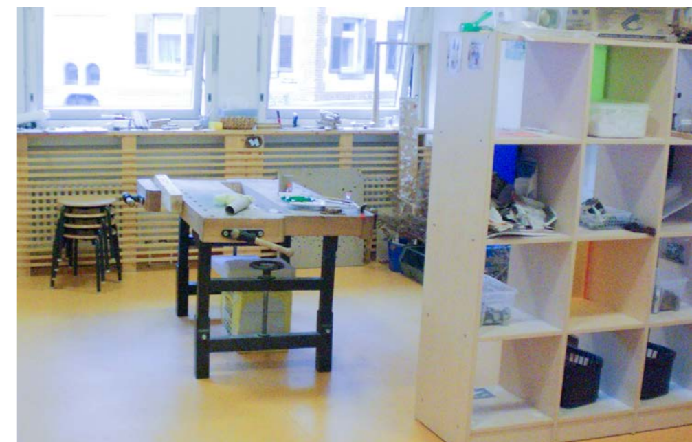
Tageseinrichtung für Kinder Tunzhofer Straße (Einstein-Kita), Stadt Stuttgart

Ein Werkraum sollte je nach Größe mit einer Werkbank bis zwei Werkbänken ausgestattet werden. Es empfiehlt sich, die Arbeitsplätze an den Werkbänken übersichtlich anzuordnen und ausreichend Platz zwischen den Werkbänken und zwischen Kindern und Werkbänken einzuplanen, damit sich die Kinder beim Arbeiten nicht verletzen oder gefährden. Im Werkraum wird mit Materialien wie Holz, Stein und Ton gearbeitet.