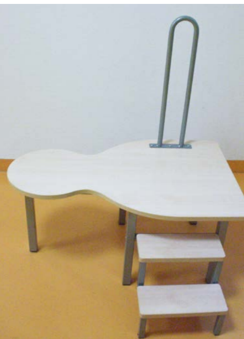
Tageseinrichtung für Kinder Tunzhofer Straße (Einstein-Kita), Stadt Stuttgart

Es ist sinnvoll, die Garderobe großzügig zu gestalten, da sie der Ort ist, an dem täglich Eltern, pädagogische Fachkräfte und Kinder zusammenkommen. Sie soll zur Kommunikation einladen und Platz für Tür- und Angelgespräche bieten.