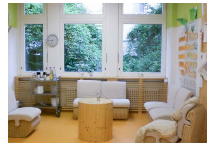
Tageseinrichtung für Kinder Tunzhofer Straße (Einstein-Kita), Stadt Stuttgart

Räumlichkeiten, die Begegnungen und Austausch ermöglichen, unterstützen den Aufbau einer gelungenen Erziehungs- und Bildungspartnerschaft zwischen Eltern und Fachkräften. Für Elterngespräche und Eltern, die ihr Kind in der Eingewöhnung begleiten, sollte ein gesonderter Raum eingeplant werden. Bei größeren Einrichtungen haben sich mehrere Räume bewährt. Werden Säuglinge in der Einrichtung aufgenommen, sollte auch ein Raum für stillende Mütter in der Planung überlegt werden. Als Variante ließe sich im Foyer zum Beispiel eine geschützte Elternecke einrichten. Bilder, Zeitschriften und Getränke gestalten den Eltern den Aufenthalt angenehm.