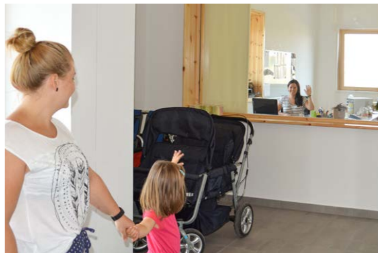
Kindertagesstätte Haus der kleinen Hasen, Gemeinde Reilingen

Die Einrichtung sollte für Kinder überschaubar sein. Für eine praktikable Organisation und eine gute Umsetzung der pädagogischen Arbeit haben