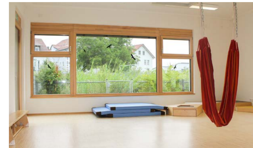
Kindertageseinrichtung Kindernest Nord-West, Gemeinde Pfedelbach

Die multifunktionale Nutzung eines Mehrzweckraums (etwa durch Vereine am Abend oder Wochenende) ist möglich, wenn dieser über einen eigenen Eingang, einen separaten Sanitärbereich und Räumlichkeiten für die Vereine (beispielsweise Lagermöglichkeiten) verfügt.