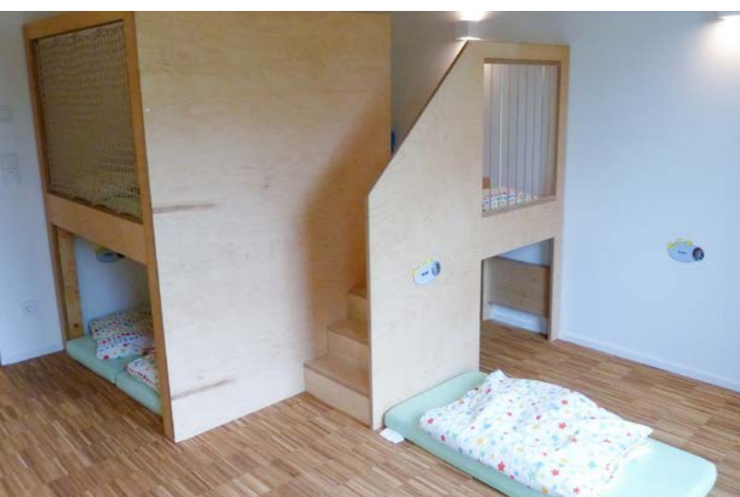
Kindertageseinrichtung Kunterbunt, Stadt Rheinfelden

Der Raum muss über eine gute Akustik verfügen, da Essen eine sehr kommunikative Situation darstellt. Dies gilt es bei der Auswahl des Bodenbelags und der Tisch- und Stuhlbeine zu berücksichtigen. Der Essbereich sollte in der Nähe zur Küche geplant werden.