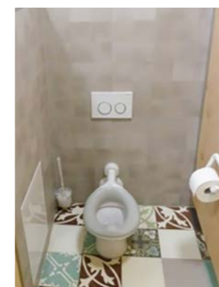
Kindertageseinrichtung Kunterbunt, Stadt Rheinfelden

Im Kleinkindbereich sind die Pflegeräume möglichst dezentral zu planen, so dass es für die Kinder kurze Wege gibt und sie sich leicht orientieren können. 1