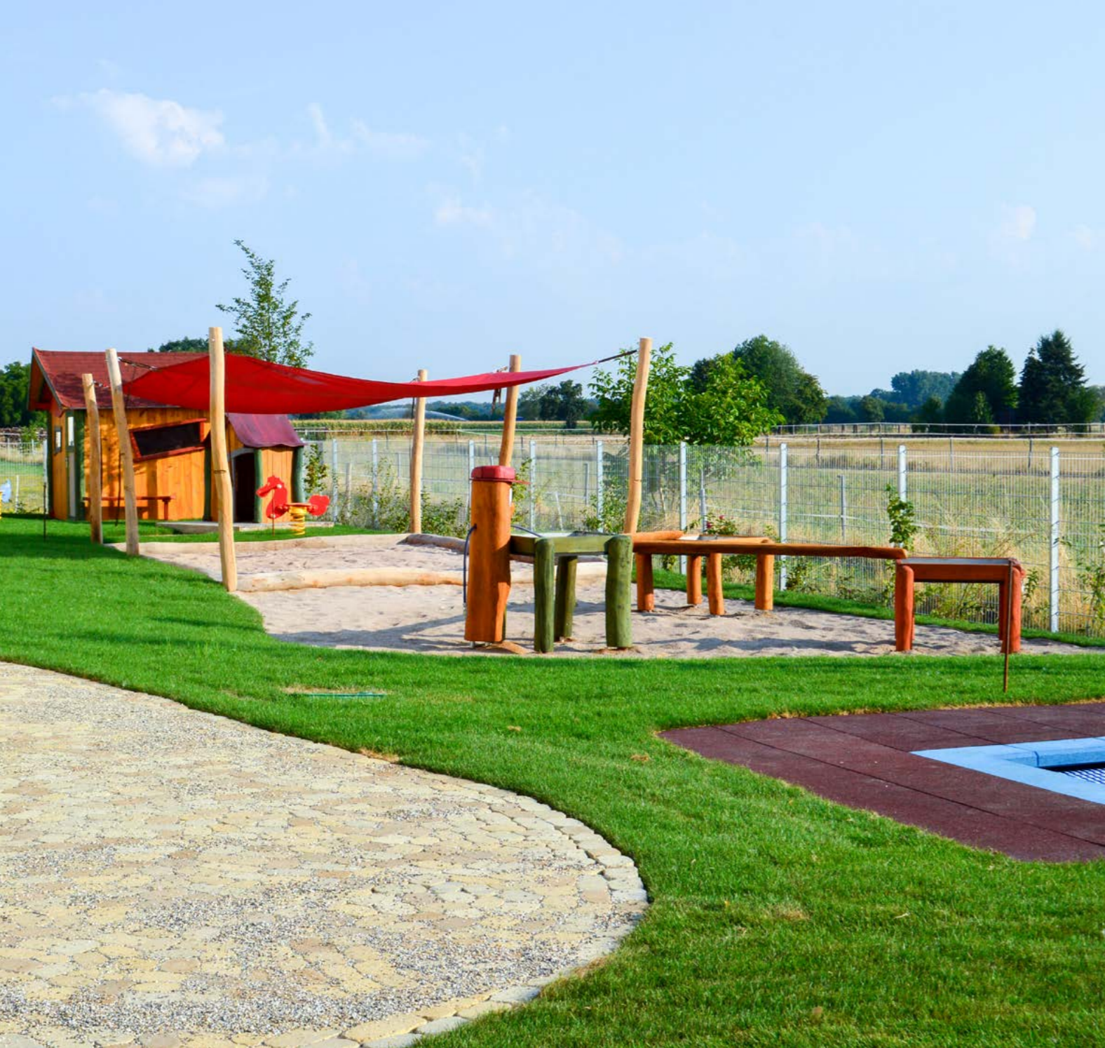
Kita Haus der kleinen Hasen, Gemeinde Reilingen

Im Ausgangsbereich zum Außengelände ist es sinnvoll eine Matschschleuse einzuplanen, in der die Kinder ihre Matschkleidung und Gummistiefel anziehen, damit der Schmutz nicht im Haus verteilt wird.