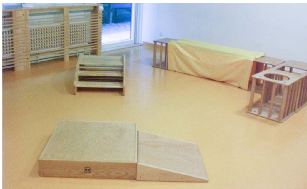
Tageseinrichtung für Kinder Tunzhofer Straße (Einstein-Kita), Stadt Stuttgart

Im Außenbereich ist ein geschützter Bereich für Kinder unter drei Jahren ratsam, in dem ihr selbstbestimmtes und autonomes Spiel gefördert werden kann. Die Material- und Geräteauswahl sollte altersspezifisch erfolgen.